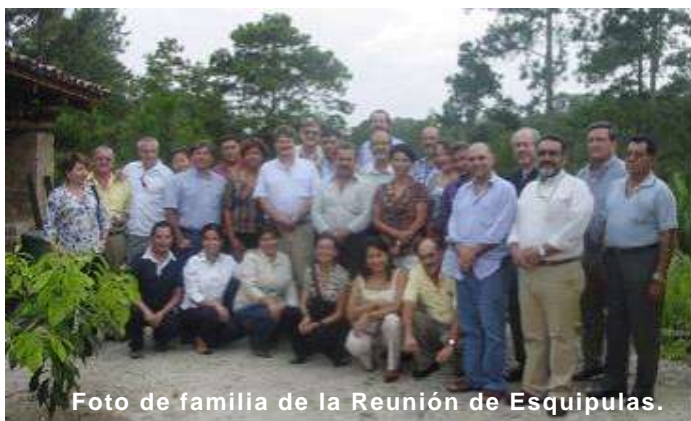
Foto de familia de la Reunión de Esquipulas.