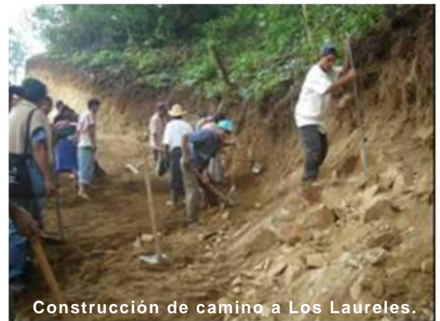
Construcción de camino a Los Laureles.

En conjunto con los habitantes de esta comunidad, se elaboró un plan para la recuperación de cultivos, animales y otros medios de vida dañados o perdidos totalmente, destacando en esta planificación participativa dos asuntos: la necesidad de un camino hacia Los Laureles, y en segundo lugar, la negociación del pago de una deuda contraída un año atrás por la compra de un terreno de loma donde reubicar a la Comunidad, y cuyos intereses ahogaban cualquier posibilidad de desarrollo.