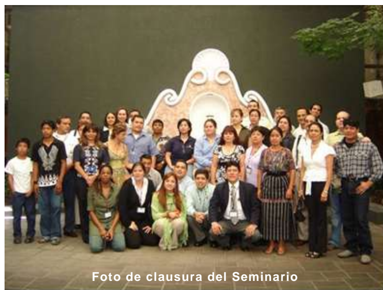
Foto de clausura del Seminario

d) materiales diseñados desde el proyecto, socializados con los participantes, rol y función de cada uno de ellos entendiendo adecuación local inicial; y e) inicio de formación de una Red Regional de divulgación e información de IAAP.