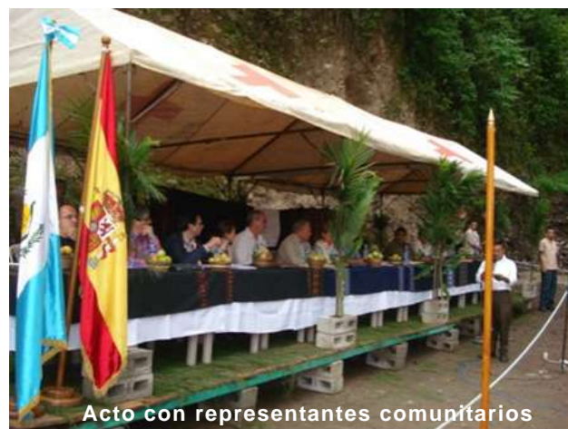
Acto con representantes comunitarios

En San Vicente Esquipulas han sido las propias familias quienes han llevado a cabo la restauración de los daños, mientras que las instituciones han complementado su esfuerzo. Para ello se creó una alianza estratégica entre la Mancomunidad de la Cuenca del Río Naranjo (Mancuerna), las Municipalidades, Fundación Solar y la Coordinadora de Asociaciones del Agua, Desarrollo Integral e Infraestructura Social de la Cuenca del Río Naranjo (Cadisna), junto a la ejecución de FAO y la financiación de AECI.