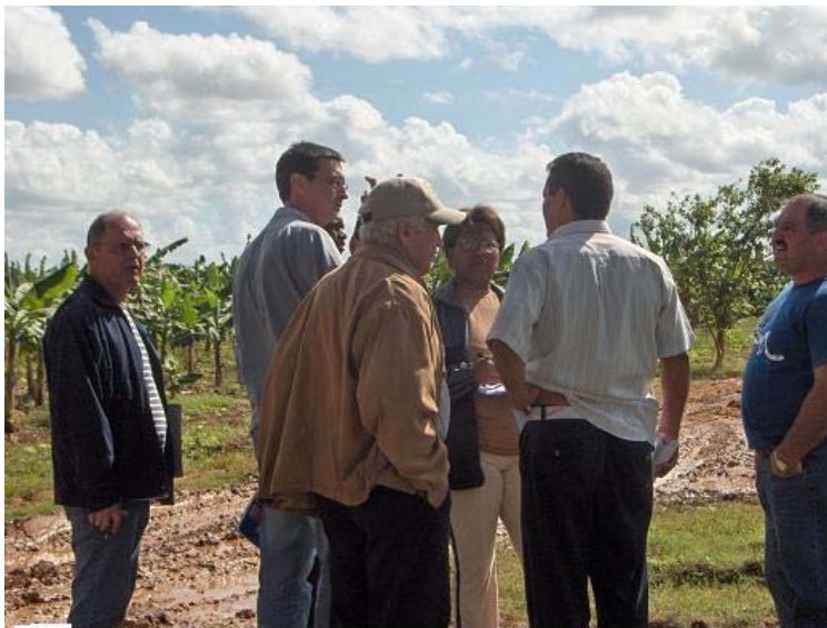
Miembros de la Misión de Formulación durante la visita realizada a una de las provincias afectadas

La Misión fue recibida por autoridades del MINVEC, del Ministerio de la Agricultura y del Ministerio de Industria Pesquera, quienes brindaron la información básica de estos sectores. Previa indicación del Gobierno, las provincias visitadas por la Misión Técnica, en el período 24-29 de noviembre fueron Pinar del Río, Holguín, Las Tunas y Camaguey, severamente afectadas por los huracanes.