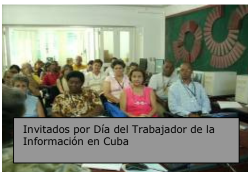
Invitados por Día del Trabajador de la Información en Cuba