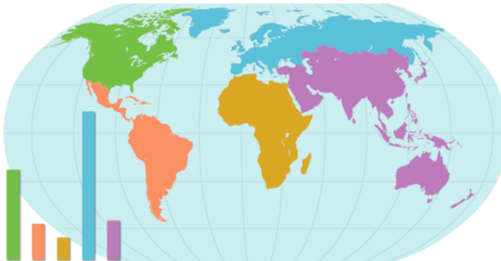
Consumo de papa por región, 2005