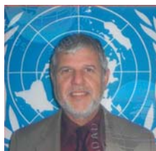
Por: Luis Castello: Representante de la FAO en Colombia

Vemos con preocupación la aparición de nuevos elementos que se suman a la amenaza permanente del flagelo mundial del hambre. A pesar de las múltiples advertencias, el mundo ha seguido actuando durante décadas con indiferencia ante esta tragedia. Solo hasta ahora, cuando comunidades enteras llevadas por el desespero y el hambre reclaman de viva voz su derecho a alimentarse, alarmados fijamos la mirada en este drama de grandes proporciones. Hoy ha dejado de ser silencioso, ocupando los titulares de los medios masivos de comunicación en todo el mundo.