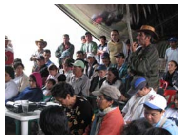
Participantes encuentro de socialización