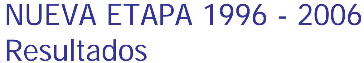
TITULOS ENTREGADOS POR GESTION Y EN RAZON DE GENERO