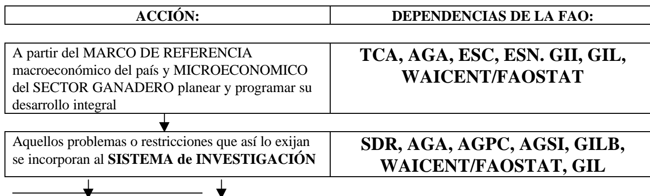
Fig. 2. Aplicación diagramática de la estructura de la FAO en el desarrollo ganadero

42. Este plan de acción debe considerar UN SISTEMA DE INVESTIGACIÓN E INNOVACIÓN TECNOLÓGICA que genere conocimientos que enriquezcan al propio sistema y tecnologías que evaluadas, mediante un SISTEMA DE VALIDACIÓN, donde participen investigadores, extensionistas y productores, en el propio entorno de los productores, y demuestren que la tecnología en cuestión sea factible, rentable, aceptada sociológicamente y que no dañe el medio ambiente; sólo aquellas tecnologías que hayan sido validadas positivamente, a través de estos criterios, serán las que los SISTEMAS DE TRANSFERENCIA DE TECNOLOGÍA incorporen a los SISTEMAS DE PRODUCCIÓN, a los SISTEMAS DE PROCESAMIENTO DE PRODUCTOS, y a los SISTEMAS DE MERCADEO Y CONSUMO.